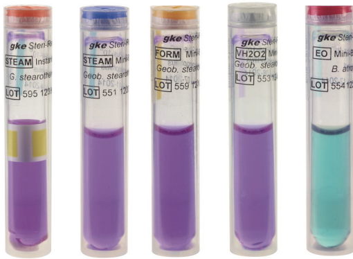
Instant-Mini-Bio-Plus SCBI für Dampf-, SCBI für Dampf-, Formaldehyd-, Wasserstoffperoxid- und Ethylenoxid-

(EP) hergestellt und laufend überprüft, um eine gleichbleibende Qualität zu gewährleisten. Die Spezifikationen für Population, D- und z-Wert sind einem Zertifikat für jede Charge enthalten, das jeder Packung beiliegt.